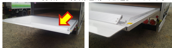
(画像は、オプションのサイドガード付)

アルミプレートには一体式キャスターストッパーを標準設定。(スチールプレートには、オプション設定) オプションで分割式・分割連動式を選択できます。